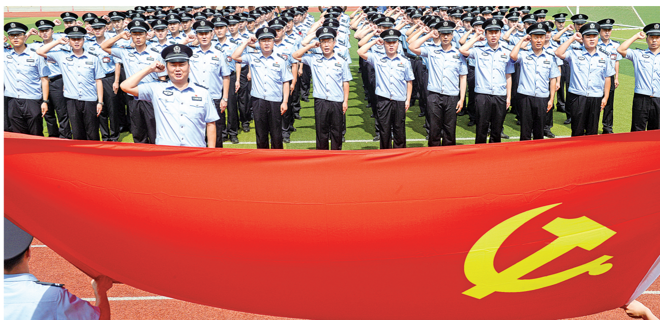
“七一”建党节来临之际,河北出入境边防检查总站组织民警开展主题党日活动,激励大家坚定理想信念,履职尽责守好国门。

灾情就是命令,时间就是生命。6月24日凌晨3时40分在接到辖区群众求助电话后,普角边境派出所迅速启动应急救援预案,第一时间派出警力赶往受灾现场。暴雨不断,进入灾区的道路成了横亘在救援民警面前的第一道难关。民警下车清理拦在路中的泥土,边向辖区广东水电公司联系,第一时间派遣挖掘机疏通公路。经过2小时努力,进入灾区道路全部疏通,民警和随后赶来的消防人员一起最先进入受灾现场。到达现场后,由于水势极大,桥梁、道路全部堵塞。民警立即分成两个小组,一组负责协助政府工作人员对危险的桥梁进行封控,及时放置警戒线和危险标志;另一组负责排查群众受灾情况,并为受灾群众发放食物和饮用水。面对灾情,全体救援人员在转移群