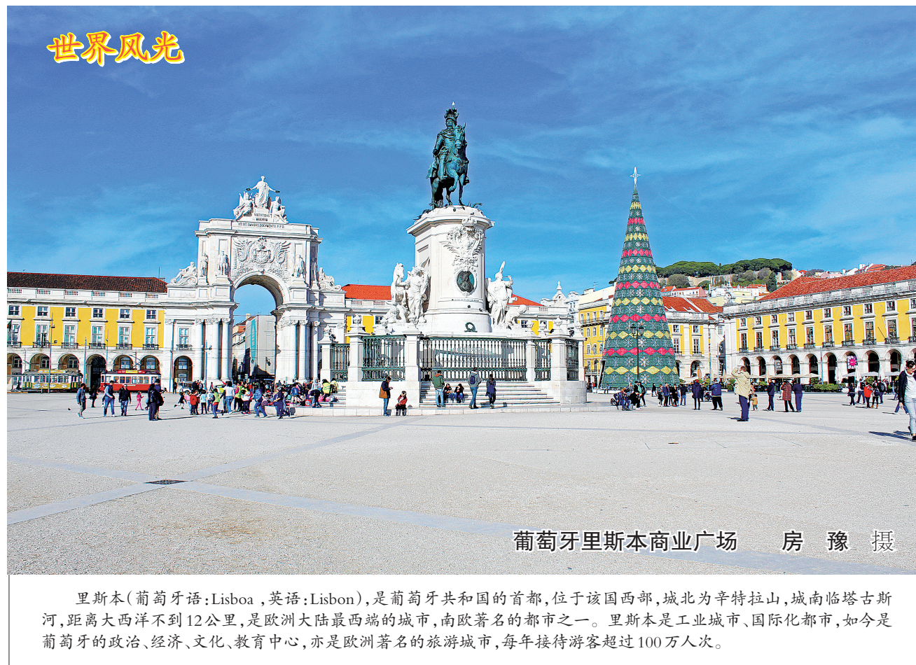
葡萄牙里斯本商业广场

去部分国家和地区是需要接种疫苗的。因此,无论短程旅游还是长期旅游,都应在出发前两周或更早到当地卫生保健中心咨询,如有必要,应及时接种疫苗。(本文摘自1月31日《中国医药报》,贺烈烈整理)