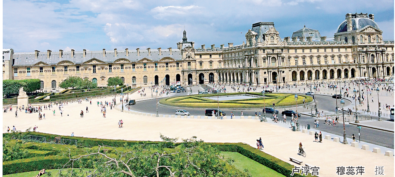
卢浮宫(法语:Musée du Louvre)位于法国巴黎市中心的塞纳河北岸,位居世界五大博物馆之首。始建于1204年,原是法国的王宫,居住过50位法国国王和王后,是法国文艺复兴时期最珍贵的建筑物之一,以收藏丰富的古典绘画和雕刻而闻名于世。1793年8月10日,卢浮宫艺术馆正式对外开放,成为一个博物馆。现为卢浮宫博物馆,占地约198公顷,分新老两部分,宫前的金字塔形玻璃入口,占地面积为24公顷,是华人建筑大师贝聿铭设计的。