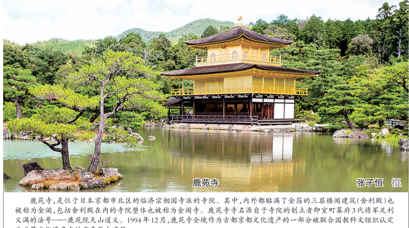
鹿苑寺,是位于日本京都市北区的临济宗相国寺派的寺院。其中,内外都贴满了金箔的三层楼阁建筑(舍利殿)也被称为金阁,包括舍利殿在内的寺院整体也被称为金阁寺。